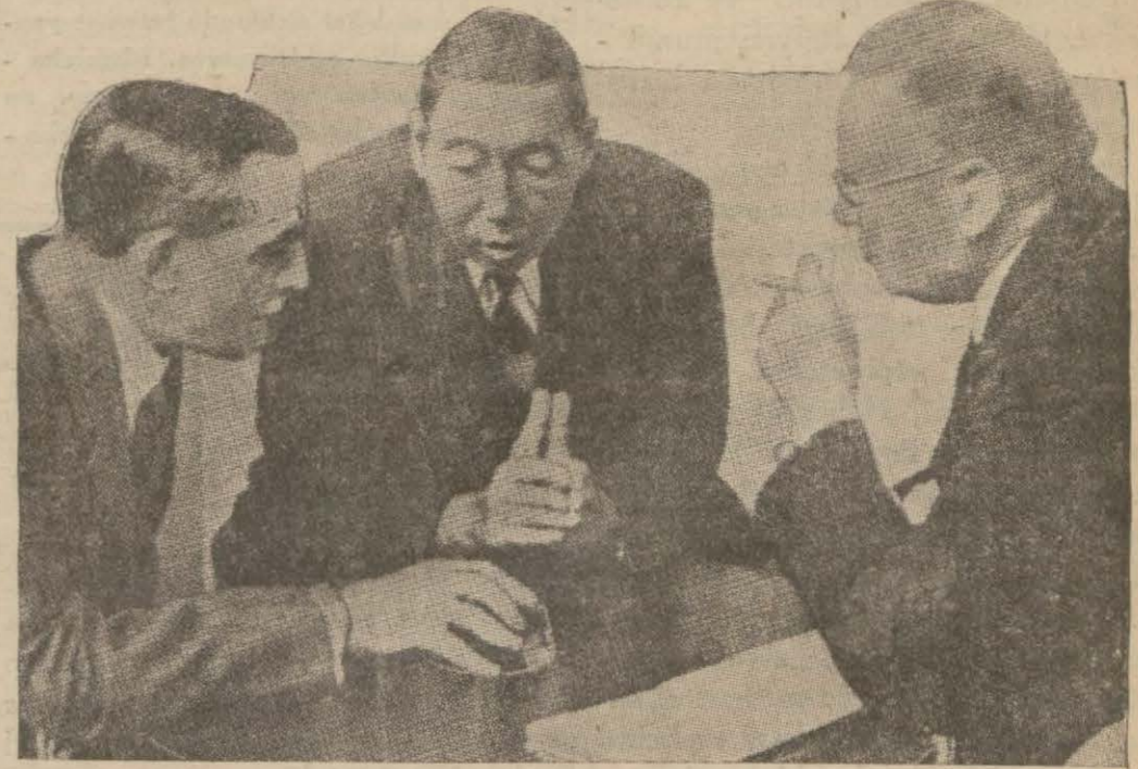
Cenevrede yapılan hususî konuşmalardan bir intiba: Sovyet hariciye komiseri Litvinof ile Romanya hariciye vekili Titulesko ve Yunan mümessili Politis başbaşa

«Şayanı teessüftür ki, Türkiye bile, Karadenizde sahildevletlerin hakları bakımından kat'i ve tebellür etmiş bir vaziyet takinmamıştır. Tevdi etmiş olduğu projede, Türkiye, Karadenizde sahildevletler memleketler gemilerinin çıkış hakkını, bu memleketlere ziyarete gelen gayri sahildevlet memleketleri için tavsiye ettiği 15 bin tonilâtoluk hadde indirilmesini teklif etmektedir. Gerçi Türk projesi Karadenizde sahildevletler memleketleri için daha geniş çıkış imkânları kabul etmektedir. Fakat, bu devletlere mensup muhtelif harp gemilerinin çıkışını, Türkiye tarafından verilecek hususî müsaadelere tâbi tutmaktadır. (Devamı 7 inci sayfada)