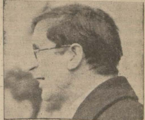
İrlanda Başvekili Dövalera